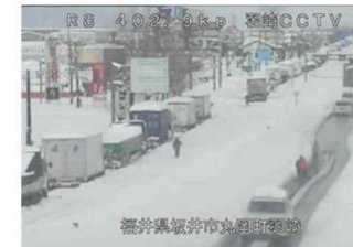
②(2/7 15時頃)4車線区間の滞留状況