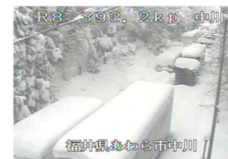
①(2/7 10時頃)2車線区間の滞留状況

○福井県嶺北地方では、平成30年2月4日から7日にかけての降雪が、6日16時までの24時間で平地でも60cmを超える記録的な大雪となった。また、あわら市から坂井市において9箇所で立ち往生車両が発生した。その影響で、約1,500台の大規模な車両滞留が発生し、約66時間の通行止めが発生した。