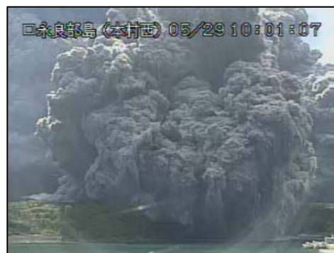
くちのえらぶしま 噴火の状況(5月29日 10時01分、本村西遠望カメラによる)

くちのえらぶしま かこしまけんやくしまちょう)では、5月29日09時59分にはげしい噴火が発生しました。口永良部島は九州の南にある小さな島で、住んでいる人たちは、全員が船でとなりの島にひなんしました。福岡県には火山はありませんが、旅行で阿蘇山や霧島山など火山に行くときには、このような噴火があるかもしれないことに注意する必要があります。