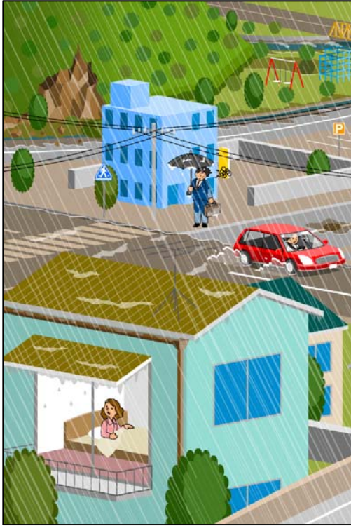
おおあめ 大雨のときの町の様子(イメージ)

いちどにたくさんのお雨がふると、川があふれたり、がけがくずれたりすることがあります。このような場所はとても危険なので、近づかない、または、逃げるのが大切です。 気象台はこのようなとき、大雨警報を発表します。テレビなどが大雨警報を伝えているときは、安全な場所にひなんしましょう。 もし、すでに道路が水につかっているときは、外に出るとかえって危険なことがあります。このようなときは家の二階にあがることもひなんの一つです。