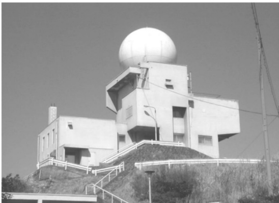
脊振山にある福岡レーダー

ところで、跳ね返ってくる電波で雨を見るので、気象台の人はこれを「エコー」と呼んでいます。「エコー」と聞くとお腹の中を見るアレ?と思われるのではないのでしょうか。「エコー」はもともと英語で、「やまびこ」など跳ね返るもののことです。お腹の中は音波、空中の雨は電波という違いはありますが、どちらも跳ね返り(エコー)を見ているのは同じです。一口に雨といっても、降り方によっていろいろなエコーの形があります。たとえば、台風を中心をとりまく発達した円形のエコーや周辺に広がる