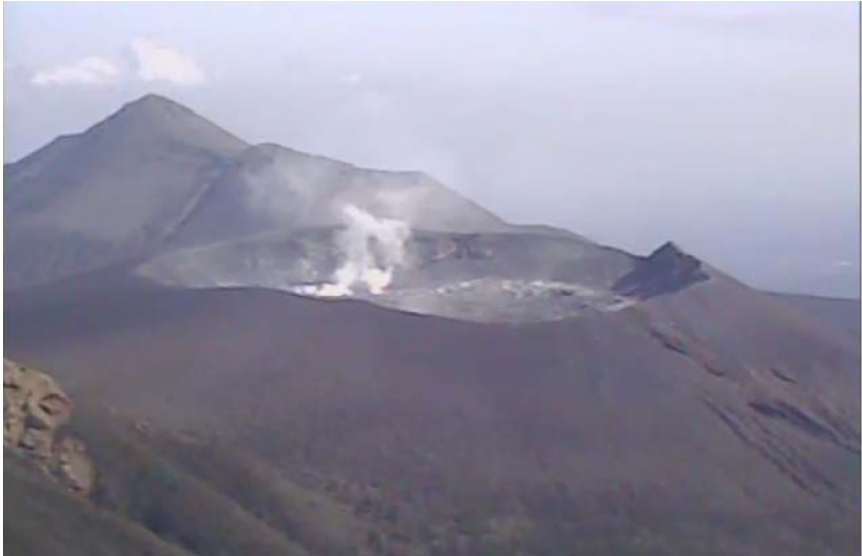
霧島山韓国岳遠望カメラによる新燃岳火口周辺の画像