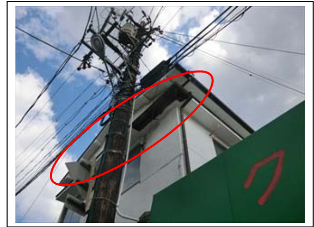
写真4 住家軒下の損壊と落下（呉市南辰川）