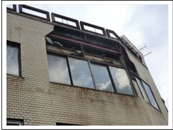
写真2 住家外壁の損壊と落下（呉市東中央）