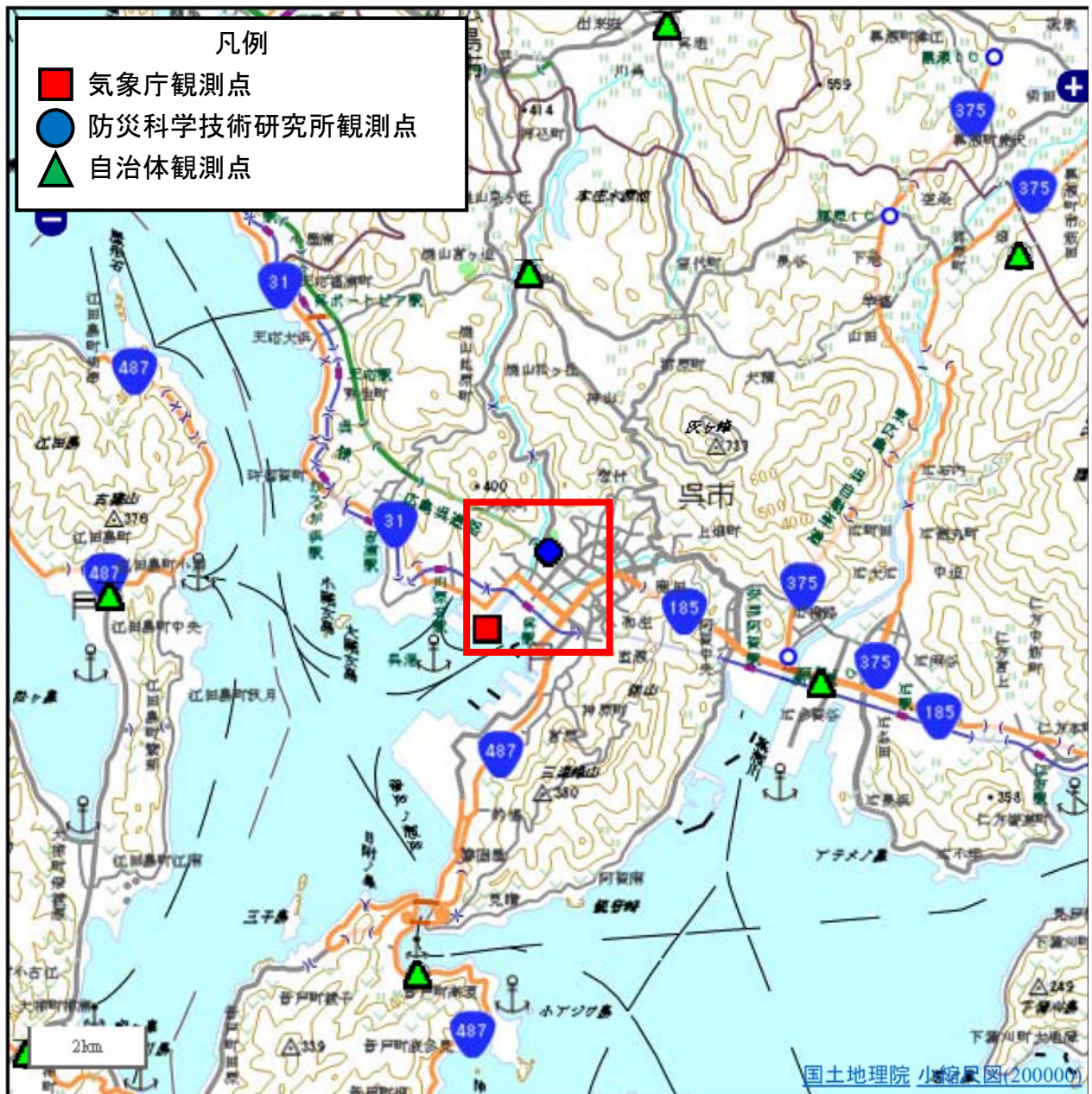
広域図 (□が次ページ調査地図の範囲)