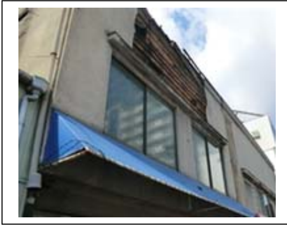
写真1 住家外壁の損壊と落下（呉市中通）