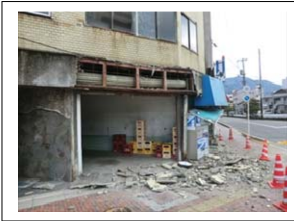
写真3 住家外壁の損壊と落下（呉市東中央）