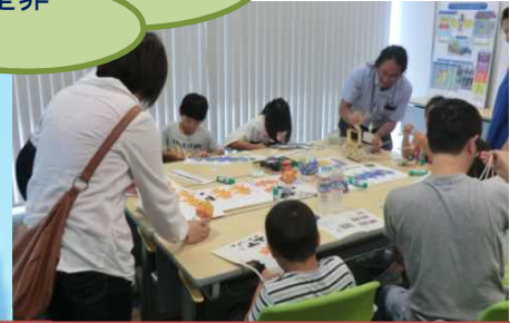
紫外線チェッカーを作ろう!