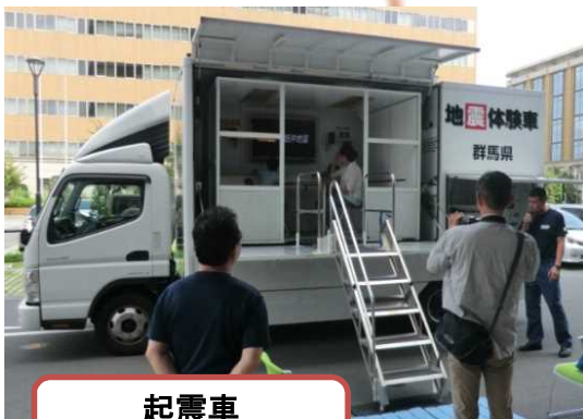
起震車 震度7の体験