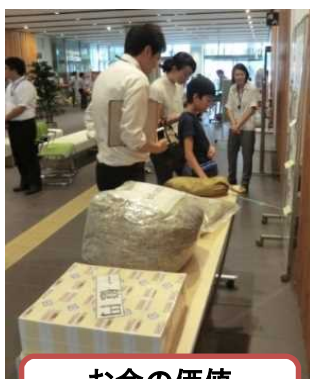
お金の価値 前橋財務事務所