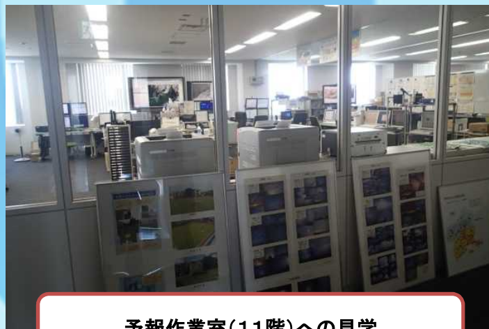
予報作業室(11階)への見学