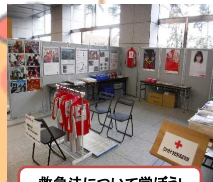
救急法について学ぼう! 日本赤十字社群馬県支部