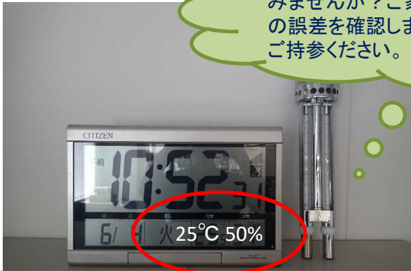
正確な温度・湿度計と家庭用温度・湿度計の比較

ご家庭にある温度・湿度計を点検してみませんか？ご家庭の温度・湿度計の誤差を確認します。この機会に是非ご持参ください。