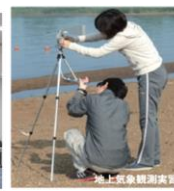
地上気象観測実習