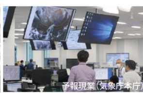
予報現業（気象庁本庁）