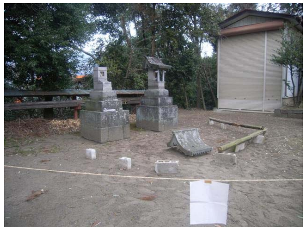
写真6 震度観測点（渋川市赤城町）付近の御前神社における灯籠の一部分が下落