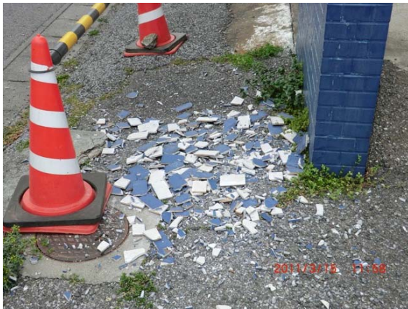
写真11 震度観測点（大泉町日の出）付近のポーリング場の外壁の一部落下跡