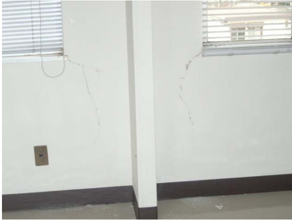
写真7 前橋市富士見支所の庁舎壁面の亀裂