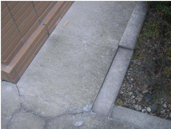
写真 15 明和町役場外壁の損傷及びコンクリートの亀裂