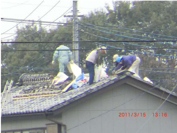
写真 13 震度観測点（千代田町赤岩）付近の住家における屋根瓦の損壊