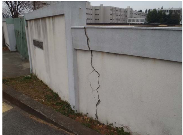
写真2 震度観測点（桐生市元宿町）付近の桐生市陸上競技場囲障の亀裂