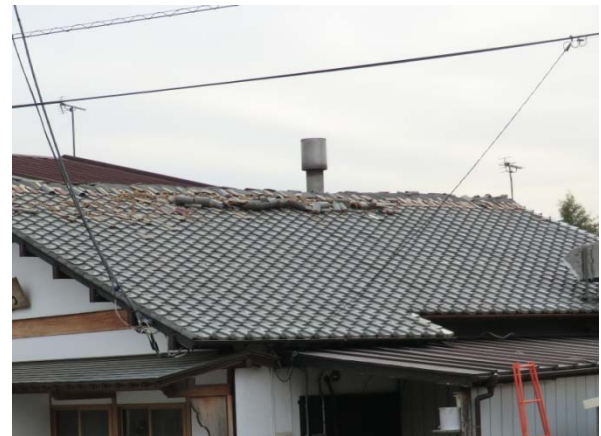
写真4 震度観測点（渋川市赤城町）付近の住家における屋根瓦の損壊