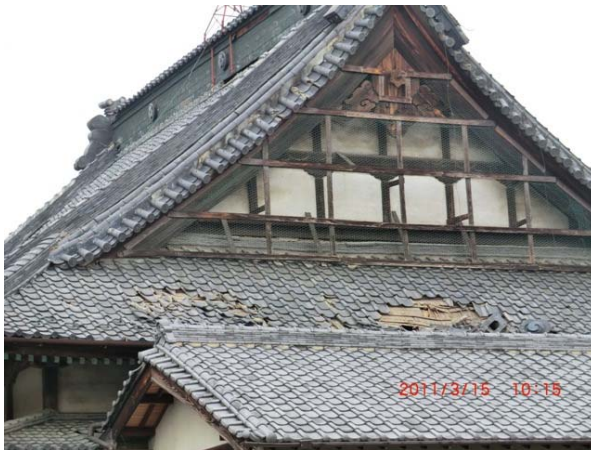
写真9 震度観測点（高崎市高松町）付近のお寺における屋根瓦の損壊