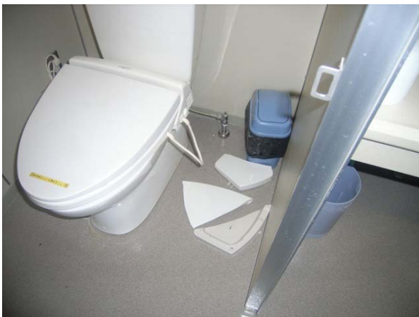
写真5 渋川市赤城総合支所の庁舎内トイレタンク蓋の破損