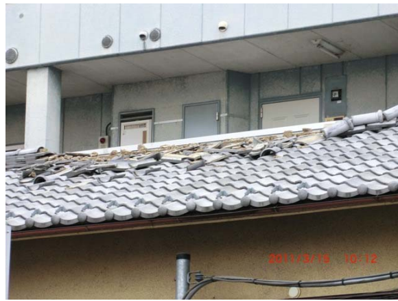
写真10 震度観測点（高崎市高松町）付近の住家における屋根瓦の損壊