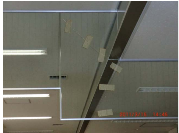
写真 16 邑楽町役場庁舎 2 階の防煙パネルのひび割れ