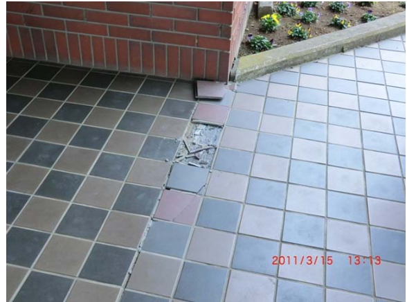
写真 14 千代田町役場玄関タイルの損傷