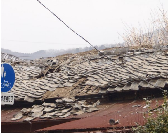
写真1 震度観測点（桐生市元宿町）付近の住家における屋根瓦の損壊