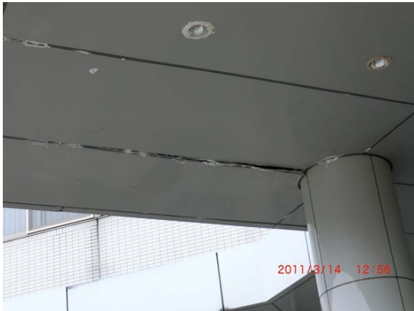
写真3 沼田市白沢支所の庁舎天井パネルの破損