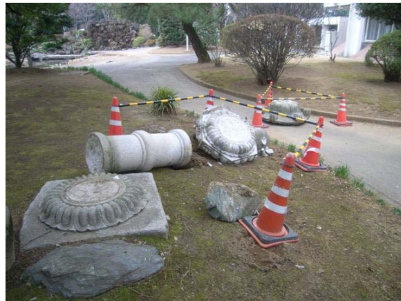
写真12 震度観測点（大泉町日の出）付近の灯籠の倒壊