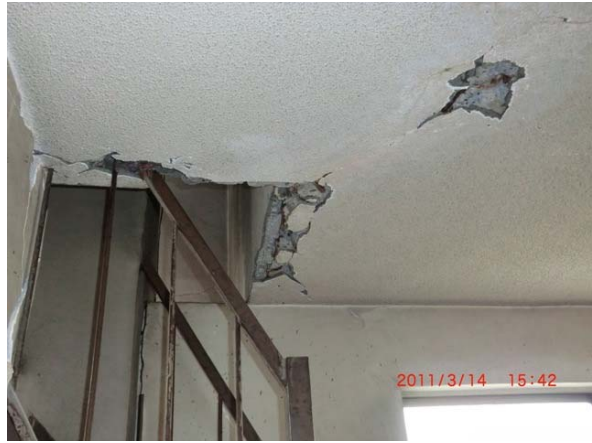
写真8 前橋市富士見支所の庁舎天井と壁の亀裂と損傷