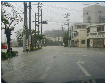
台風第14号に伴う高潮で道路が冠水 この付近の標高は2.4m(2003年9月11日平良港付近)

下の写真は、それぞれ2003年の台風第14号による宮古島市平良港付近の高潮、2011年の異常潮位時の川満漁港の冠水の状況です。