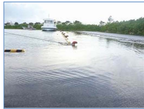
大潮の満潮に異常潮位が重なり港内敷地が冠水 (2011年8月29日 川満漁港)

宮古島地方気象台では、台風の動向や潮位の変動を常に監視しており、台風等に伴う高潮などが予想される場合は注意や警戒を呼びかけます。気象台が発表する高潮特別警報、高潮警報、高潮注意報など最新の防災気象情報に留意してください。