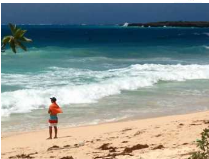
台風接近前に渡口の浜へ打ち寄せる波の様子