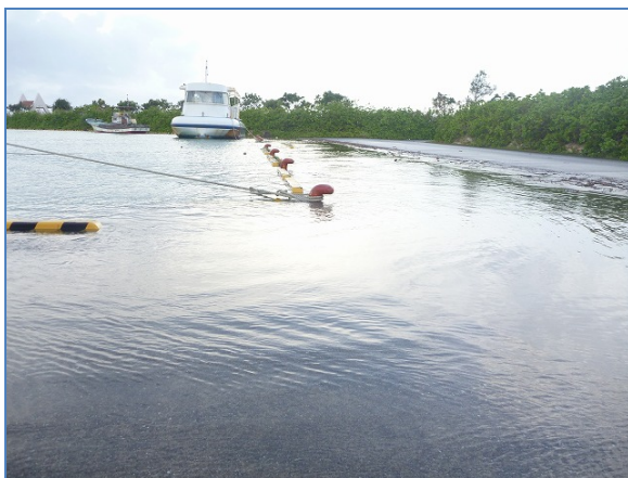
図3. 異常潮位に大潮の満潮が重なり港内敷地が冠水 (平成23年8月29日 川満漁港)