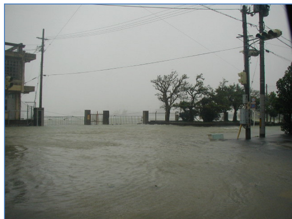
図4. 台風第14号に伴う高潮で道路が冠水 この付近の標高は2.4m (平成15年9月11日 平良港付近)