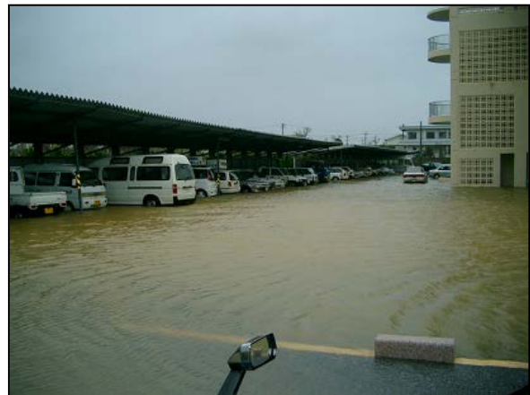
写真2 高潮による駐車場の冠水 (2003年9月11日 宮古島市下地庁舎)