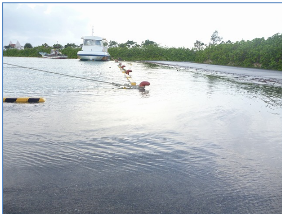
写真1 異常潮位による港内敷地の冠水 (2011年8月29日 川満漁港)

満月または新月の前後数日間 (大潮の時期) は満潮の潮位 (青線) が特に高くなる。