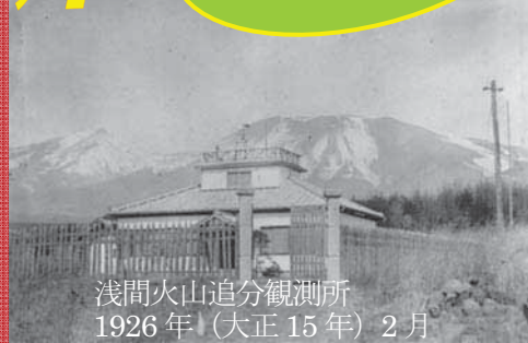
浅間火山追分観測所 1926年（大正15年）2月

現在では、気象庁や東京大学地震研究所等により、地震計、傾斜計、GPS、遠望カメラ等の観測機器が多数整備され、山体の微小な変動を計るなどして、噴火の前兆をつかむ体制が敷かれています。