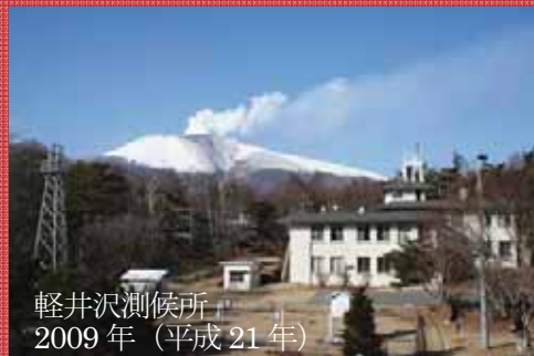
軽井沢測候所 2009年（平成21年）

平成23年8月27日（土） 長野県軽井沢町 中央公民館大講堂 13時00分～16時25分