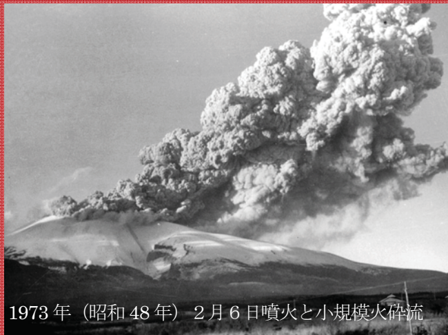
1973年（昭和48年）2月6日噴火と小規模火砕流

□前橋地方気象台 電話027-231-1404 □利根川水系砂防事務所 電話0279-22-4177