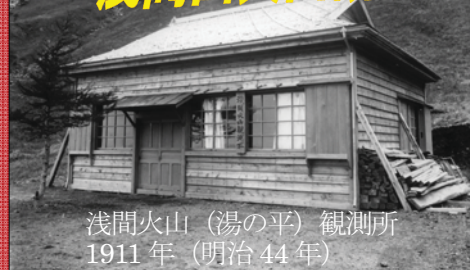
浅間火山（湯の平）観測所 1911年（明治44年）