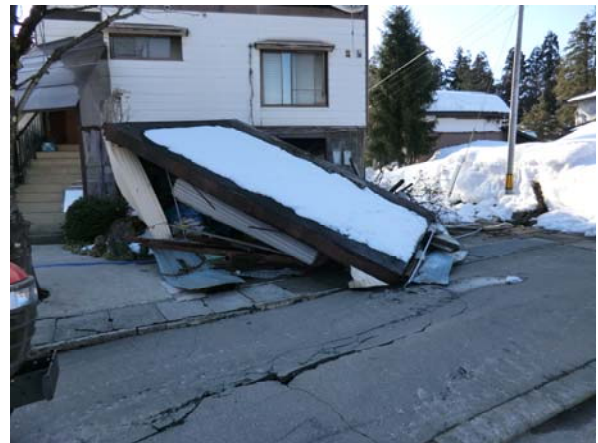
写真8 栄村の民家の車庫損傷