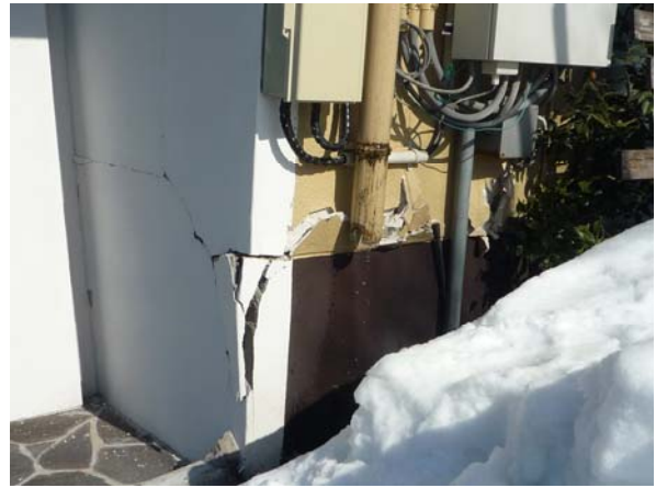
写真4 十日町市上山中里の民家側壁損傷