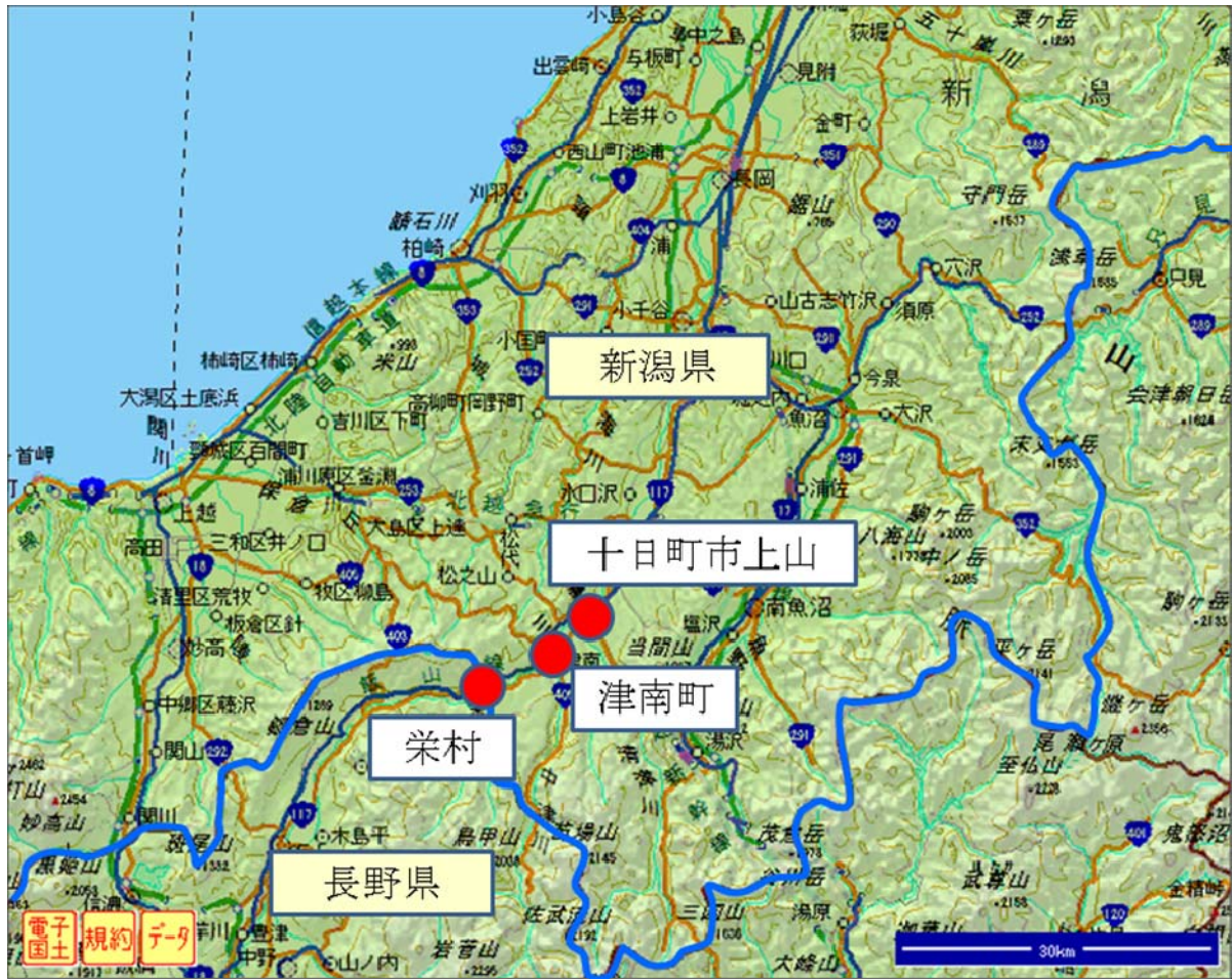
図1 現地調査実施地域 周辺図