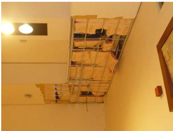
写真1 十日町市上山のスーパー天井損傷