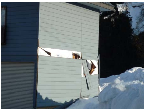
写真7 栄村の民家損傷