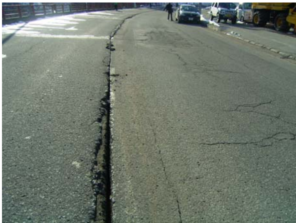
写真5 栄村の道路ひび割れ