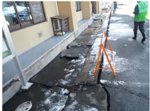
写真6 栄村役場入口付近のひび割れ