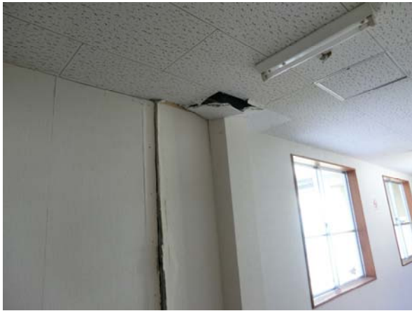
写真3 十日町市上山中里公民館損傷