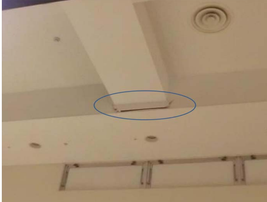
写真1 建物（ショッピングセンター）の内壁ひび割れ （新潟県十日町市上山）