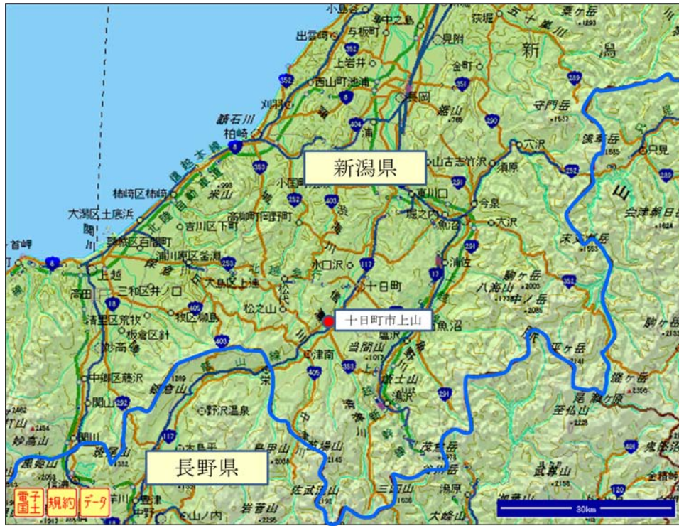
図1 現地調査実施地域 周辺図