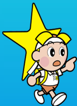
岡山県マスコット「ももっち」