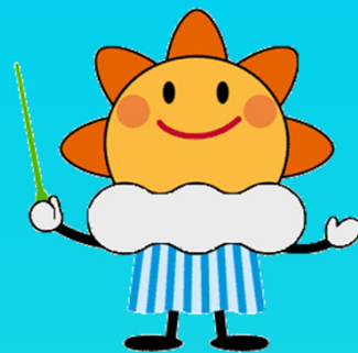
気象庁マスコットキャラクター「はれるん」