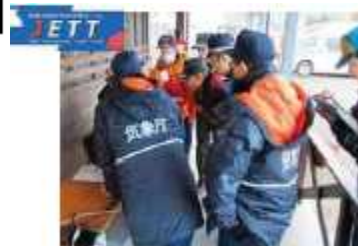
災害下現場で気象解説する JETT ※JETT(気象庁防災対応支援チーム)