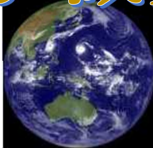
気象衛星ひまわり画像