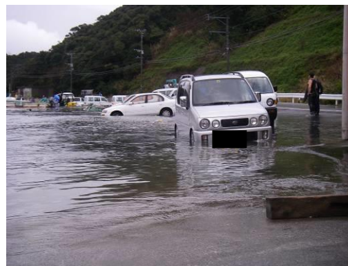
2009年2月25日の鹿児島県上甕島での道路冠水