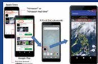
図1：ひまわりリアルタイムアプリケーション(千葉大・高知大の画像処理ツール活用)