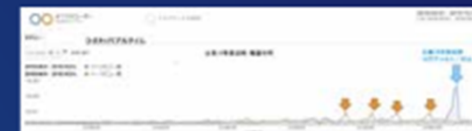
図3：(a) 2018年と2019年の日アクセス数(4月～10月)