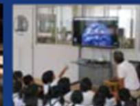
土庄小学校(香川県)