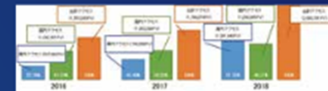
図3：(b) 2016～2018年の年アクセス数推移