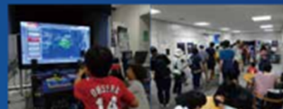
NICT オープンハウス2019 体験ブース