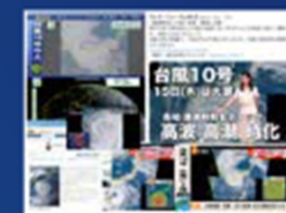
図4：2019年ひまわりリアルタイム報道利活用事例(台風19号)