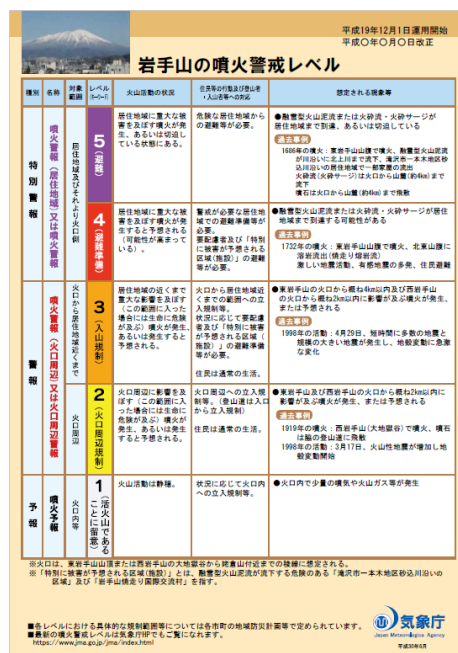
(3月20日に掲載するリーフレット：左=表面、右=裏面)