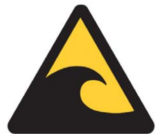
つなみちゅうい 津波注意