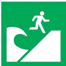
つなみひなんばしょ 津波避難場所