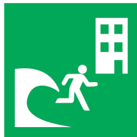
つなみひなん 津波避難ビル