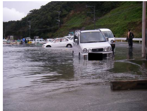
2009年2月25日の鹿児島県上甕島での道路冠水