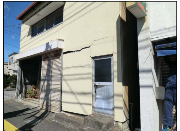
写真4 震度観測点（富士宮市弓沢町）付近の住家における壁の亀裂