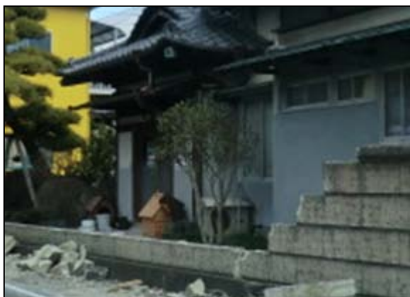
写真5 震度観測点（富士宮市弓沢町）付近の住家におけるブロック塀の倒壊