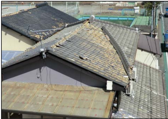
写真3 震度観測点（富士宮市弓沢町）付近の住家における屋根瓦の損壊