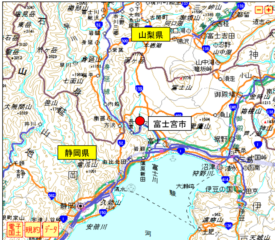
図1 現地調査実施地域 周辺図