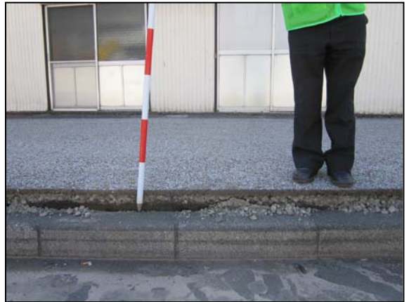
写真2 震度観測点（富士宮市弓沢町）付近の富士宮市役所北側道路の沈降