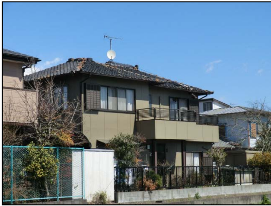
写真1 震度観測点（富士宮市弓沢町）付近の住家における屋根瓦の損壊