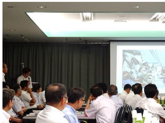
レクチャーの様子

日時：平成29年6月23日（金曜日）14時00分～16時30分 場所：日本赤十字社静岡県支部 対象：県内の小・中・高等学校の校長先生（副校長先生・教頭先生）