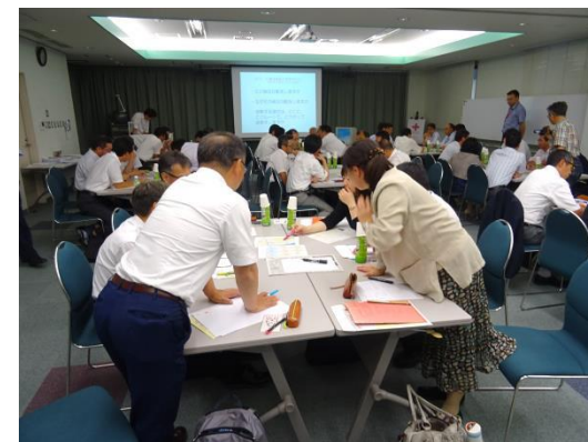
グループワークの様子