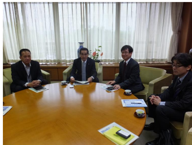
御前崎市市長（左から2人目）と気象台長（右から二人目）