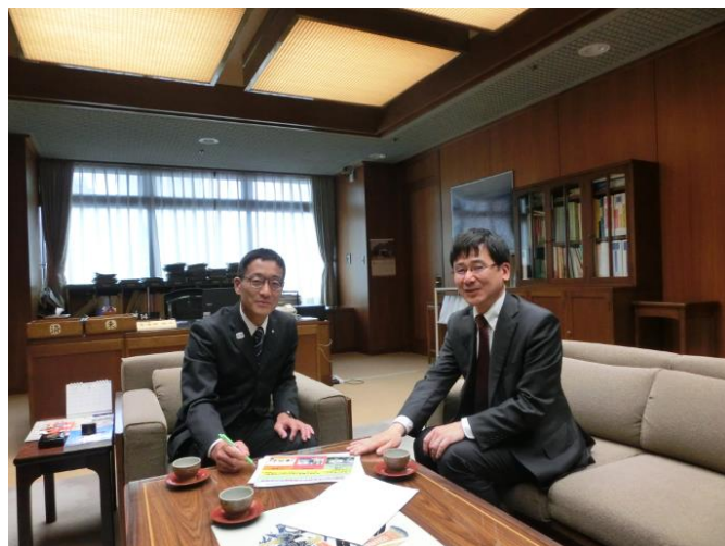
静岡市副市長（左）と気象台長（右）