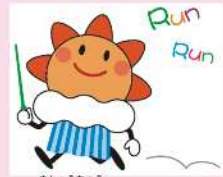
気象庁マスコット はれるん