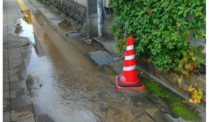
写真8 市街地歩道、漏水 (倉吉市葵町)