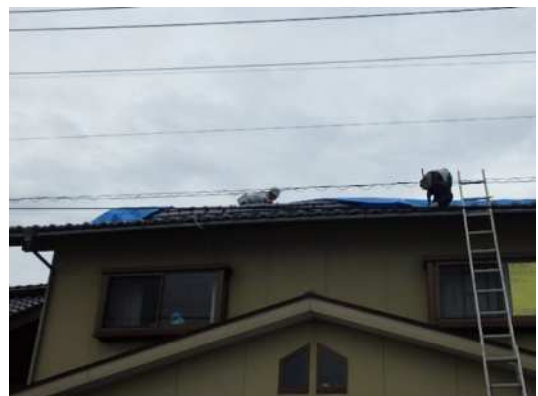
写真12 住家屋根瓦ずれ (北栄町由良宿)