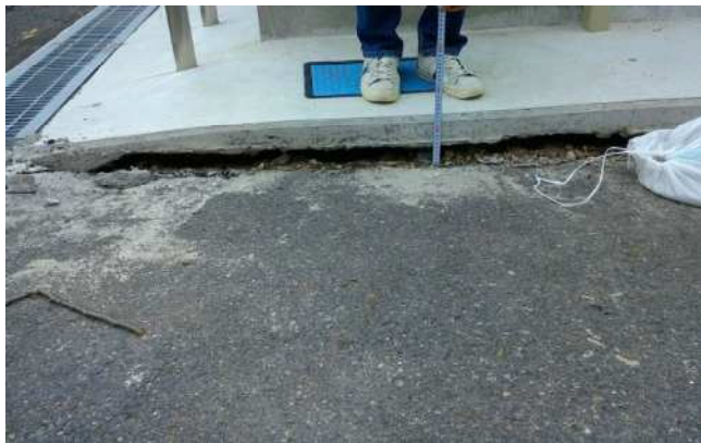
写真9 アスファルト面の陥没 (湯梨浜町龍島)