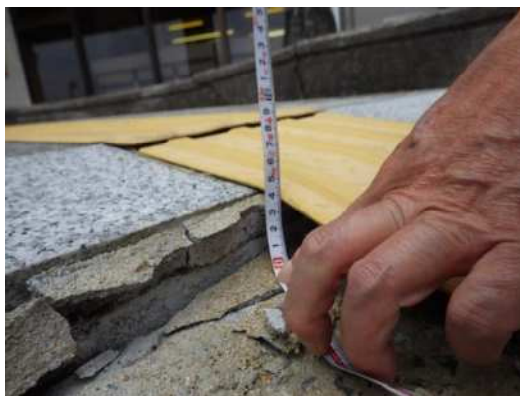
写真11 公民館歩道、陥没 (北栄町土下)