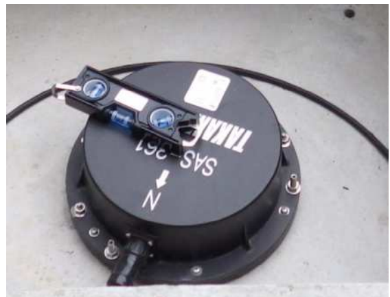
写真6 湯梨浜町龍島