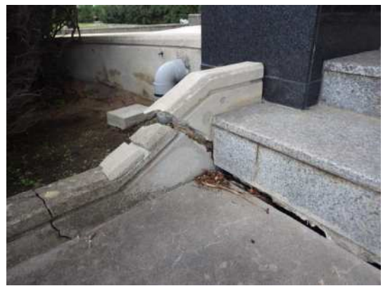
写真10 公民館の玄関階段基礎に亀裂 (北栄町土下)