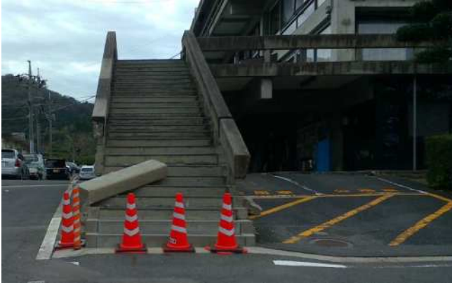
写真7 市役所のコンクリート製手すりが落下 (倉吉市葵町)