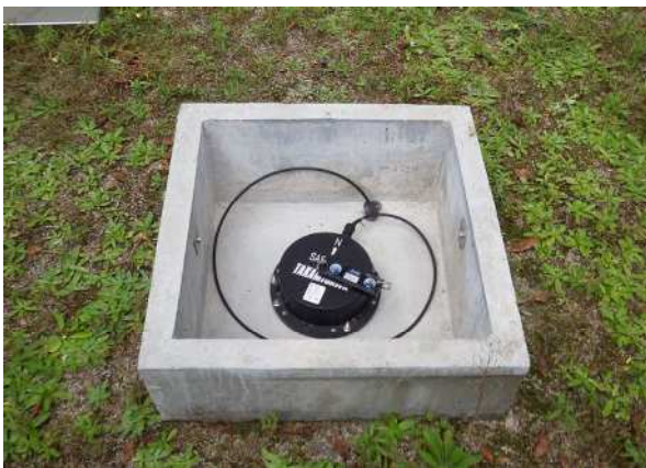
写真5 湯梨浜町龍島