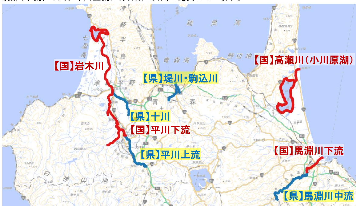
図 1 指定河川洪水予報実施河川

指定河川洪水予報は、川の規模が大きいいため洪水によって重大な損害や相当の被害が発生するおそれのある河川を対象としています。青森県内で発表対象となっているのは、8河川です。馬淵川下流、岩木川、平川下流は青森河川国道事務所と共同で、高瀬川（小川原湖）は高瀬川河川事務所と共同で、堤川・駒込川、馬淵川中流、十川、平川上流は青森県と共同で発表しています。