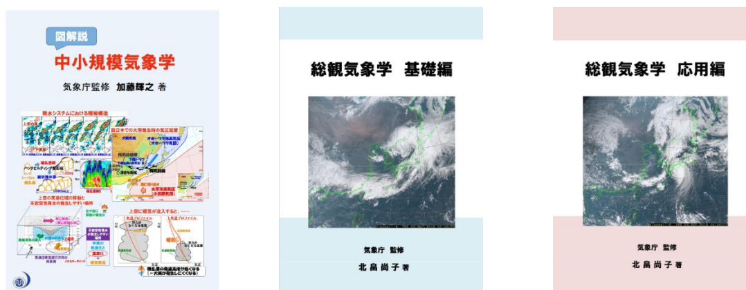
図4 気象庁で作成した気象学の教科書の表紙。左から「図解説中小規模気象学」「総観気象学基礎編」「総観気象学応用編」

さらに、同ページにはそれらの資料を理解する手助けとなる気象学の教科書も掲載しています。これらの教科書は、気象庁内の研修でも利用されているテキストとなっており、他の教科書とはまた違った切り口で、気象学を学ぶことができます。意欲のある方は、ぜひこの教科書で学習してみてくださいはいかがでしょうか。