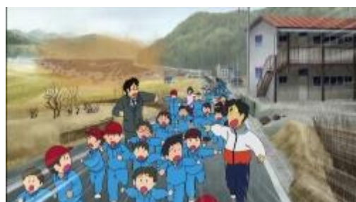
図2 津波防災啓発ビデオ「津波からにげる」アニメーションの一場面