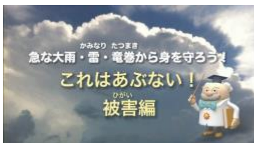
図1 防災啓発ビデオ「急な大雨・雷・雹巻から身を守ろう！」タイトル画面

また、青森地方気象台ではこれら防災学習ビデオのDVD 貸し出しを実施しております。DVD プレイヤーで視聴したいという方は当気象台までお問い合わせください。