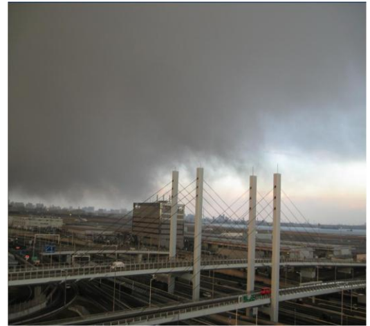
第1図 羽田空港で観測された尾流雲 (2011年1月26日16時35分撮影)

また、東京都内には、不明瞭ながら対流雲から吹き出す北風と南風（海風）とのシアーラインが解析できます。16時には対流雲の南下により気温が低下し、周囲に向かって冷氣外出流の風が吹きだし、対流雲の南側の羽田空港付近でシアーラインが明瞭となりました。この対流雲は17時にかけて南東進して空港を通過し空港の東側にぬけ、次第に激しい現象も収まりました。