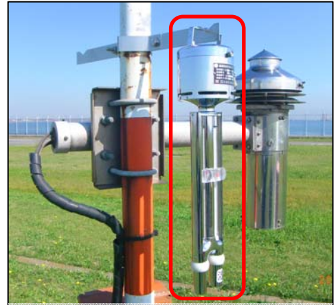
図6 携帯用通風乾湿計

代替観測の際は携帯用通風乾湿計を用いて、乾球の値を気温として、湿球と乾球の差や飽和蒸気圧値などから計算した露点温度を、MEATR等で通報することとしています。