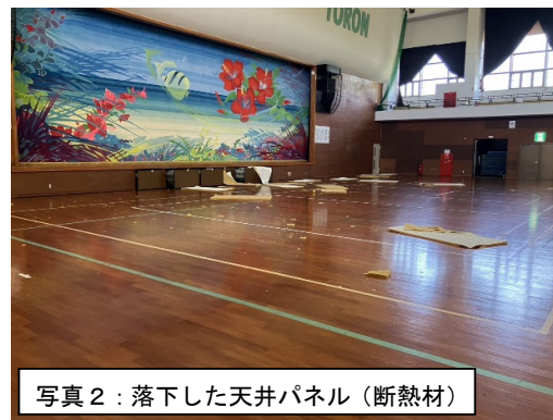
写真1、2 体育館の天井パネル（断熱材）の落下（砂美地来館：与論町茶花）