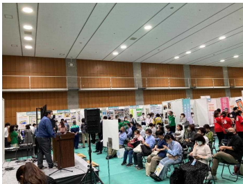
写真1 イグナイトステージ

メイン会場のHAT神戸では、講義型セッション・イグナイトステージ（写真1）、体験型ワークショップ（写真2）、ブース展示（写真3）など、様々な形式で防災学習が企画されました。講義型セッションでは、防災に関する様々な講演、体験型ワークショップでは、ゲーム形式で災害のシミュレーションの実演、ブース展示では、最新の防災グッズの紹介など、防災について様々な角度からのアプローチがありました。気象台からは、「津波フラッグ」の紹介（写真4）や液状化現象の実験（写真5）を展示