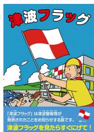
写真7 津波フラッグ(左)と、学習の様子(右)