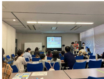
写真2 ワークショップ