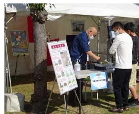
写真5 液状化現象実験

し、地震防災の理解を深めていただきました。セッションやワークショップでは、オンラインで参加できるイベントも数多く企画されるなど、防災を考える貴重な機会となりました。