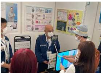
写真3 気象台展示ブース