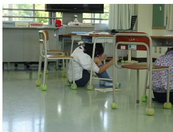
写真6 シェイクアウト訓練

兵庫県では、南海トラフ地震や日本海または沿岸で発生した地震での津波による浸水が想定される県内15市3町に滞在している方に対し、避難を呼びかける緊急速報メール（エリアメール）が配信される「兵庫県津波一斉避難訓練」が実施されました。本訓練ではエリアメール鳴動にあわせてシェイクアウト訓練を行ったり（写真6）、自宅や学校、勤務先の最寄りの避難場所までの経路を確認するなど、地震への備えを再確認しました。神戸聴覚特別支援学校では、報知音の覚知が困難な人にも津波警報等