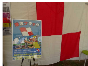
写真4 津波フラッグ紹介