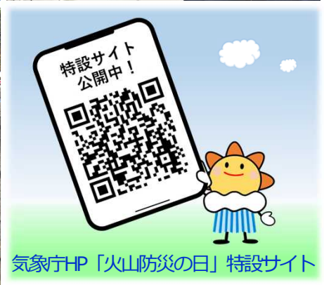
気象庁HP「火山防災の日」特設サイト