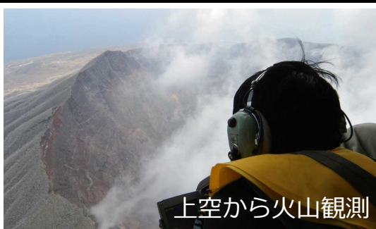
上空から火山観測