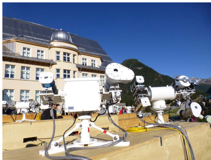
口絵 3 アジア地区準器

世界放射センターでは、型式の異なる6台の絶対放射計(高精度な直達日射計)を日射計の世界準器群として運用している。