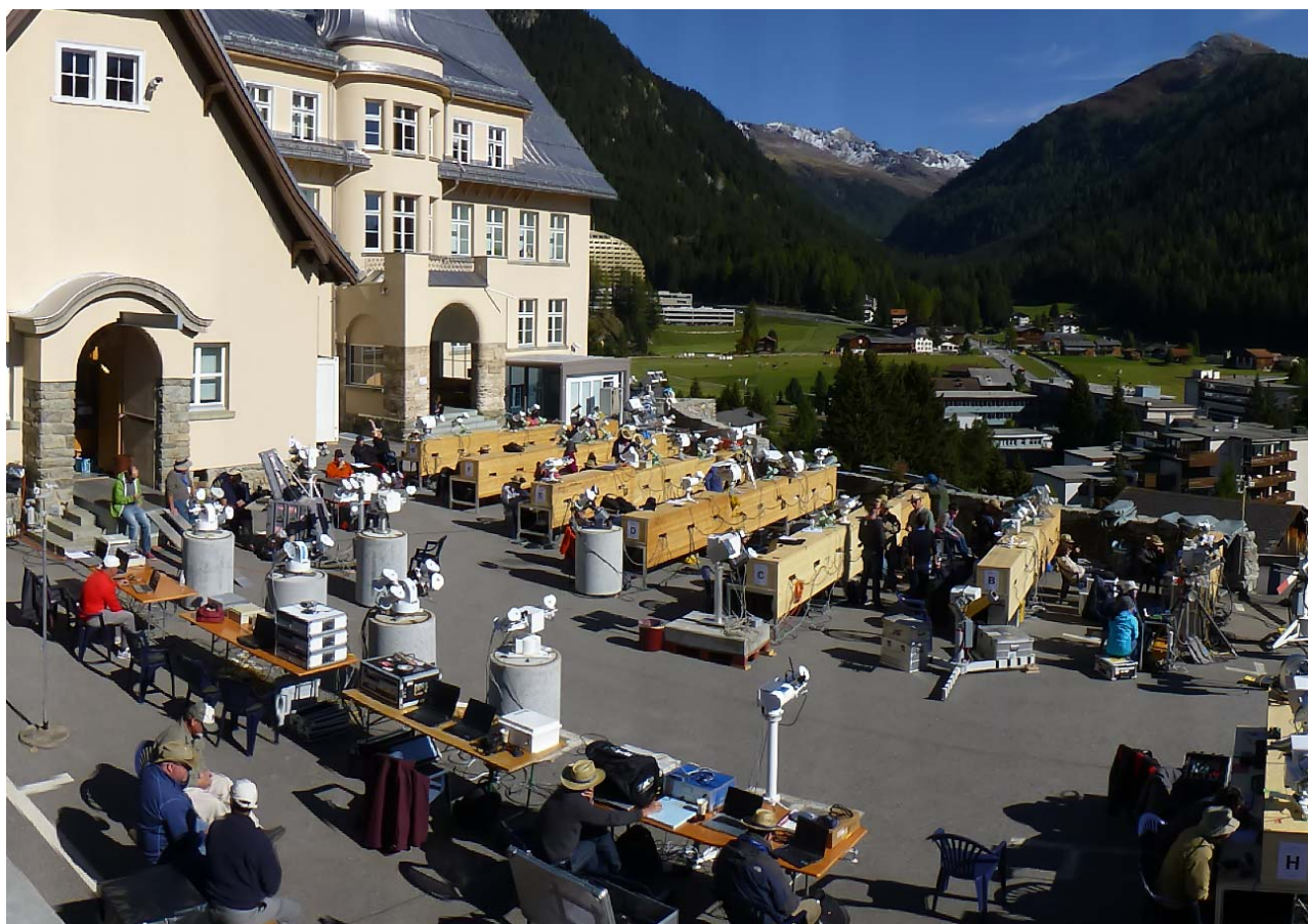
口絵 4 国際日射計比較における観測風景

世界放射センターの駐車場には特製テーブル(木製)等が設置され、参加者は所定の場所で太陽追尾装置、絶対放射計、パソコンなどを用いて比較観測を行う。第 12 回国際日射計比較には、世界 33 カ国の 52 機関から 111 名が参加した。