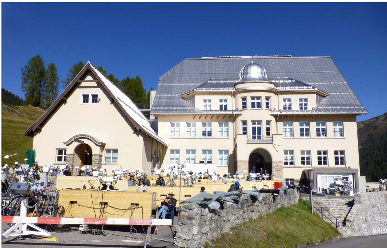
口絵 1 世界放射センター(ダボス物理気象観測所)

国際日射計比較は、世界放射センターを務めるスイス連邦・ダボスにあるダボス物理気象観測所において、5年毎に開催される。