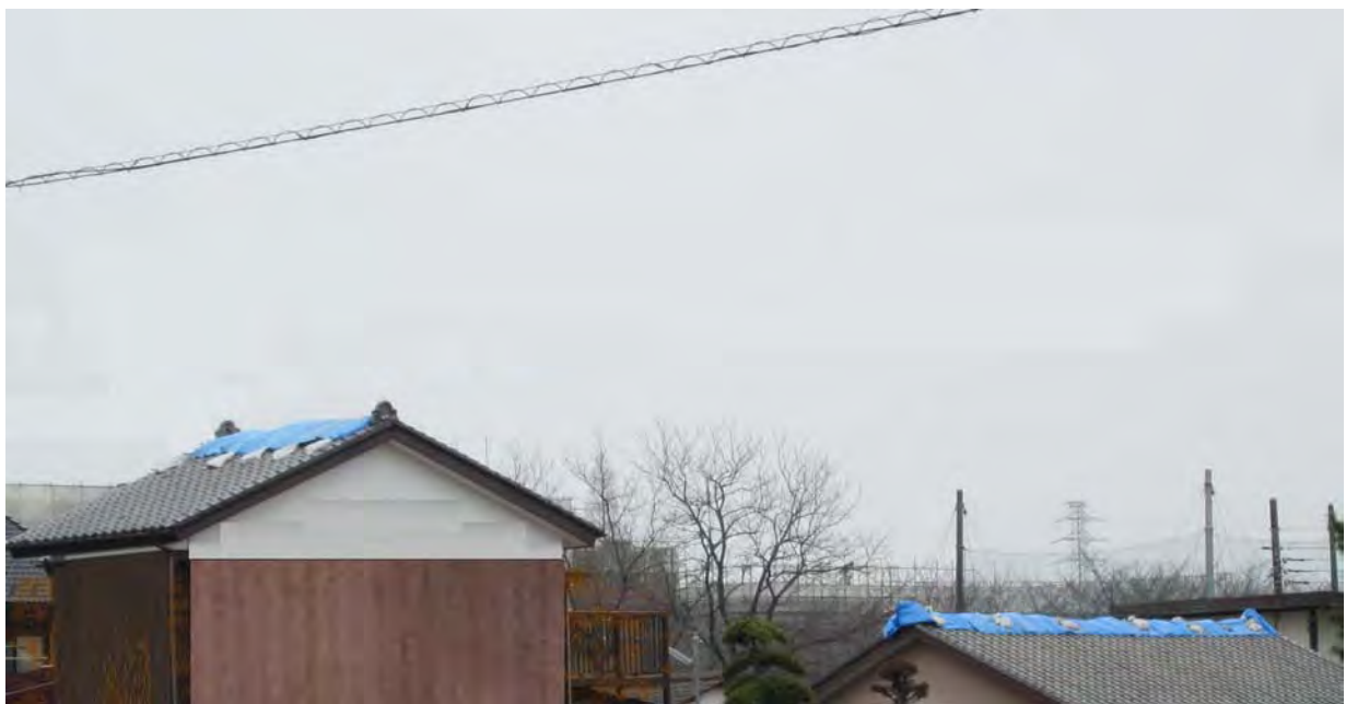
写真1 家屋屋根瓦のずれ・落下(南埼玉郡宮代町笠原)