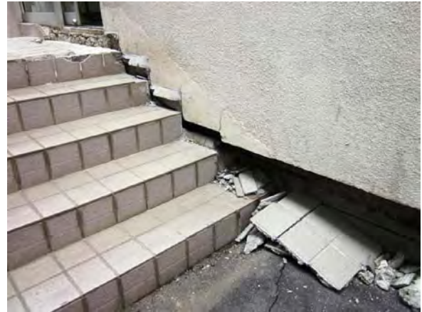
写真6 市役所周辺の地面沈下 (地面沈下幅 0.1m) (幸手市東)