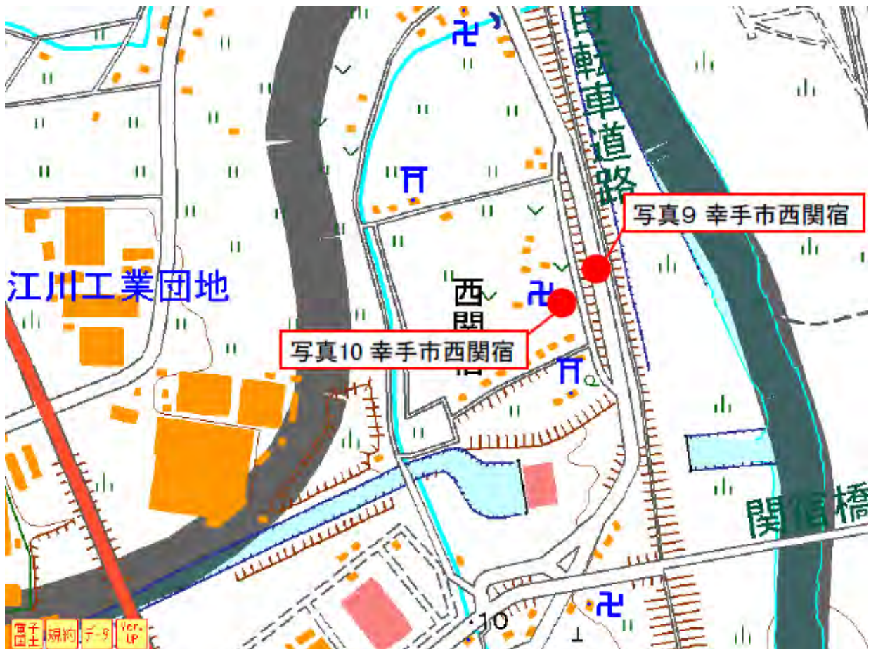
図5 幸手市西関宿周辺拡大図（幸手市西関宿）