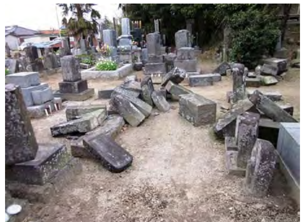
写真10 墓石転倒 (幸手市西関宿)