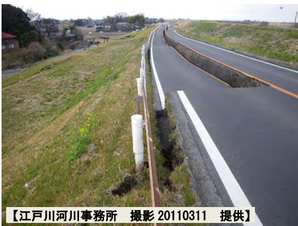
【江戸川河川事務所 撮影 20110311 提供】