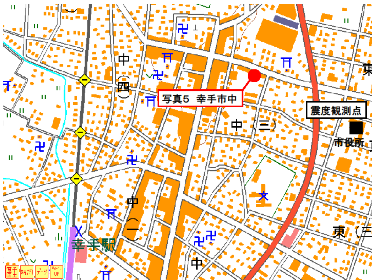
図3 震度観測点周辺図(幸手市中)