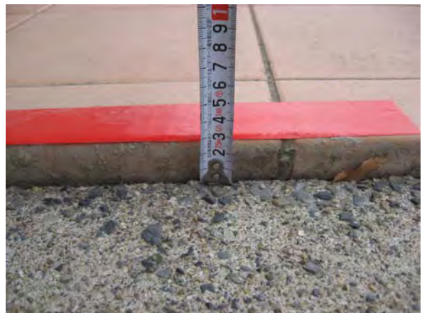
写真4 宮代町庁舎東側の地面陥没（幅 5.6m 陥没深さ 0.02m）（南埼玉郡宮代町笠原）