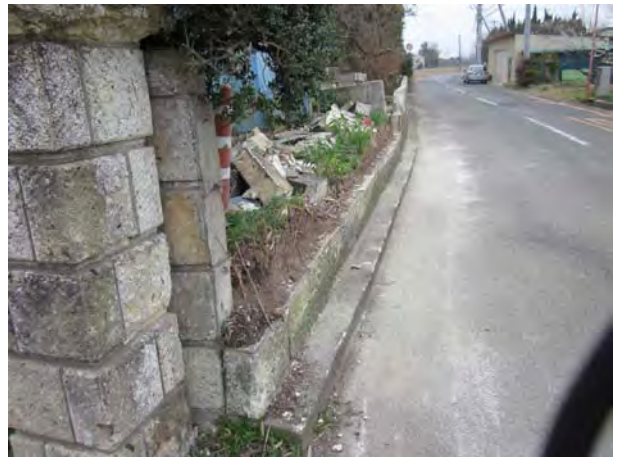
写真2 ブロック塀の破損（南埼玉郡宮代町東条原）