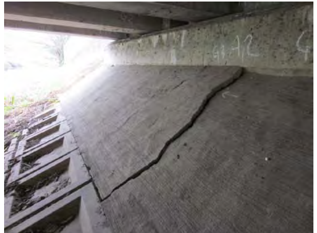
写真3 橋梁接続部の道路陥没及び亀裂（南埼玉郡宮代町百間）