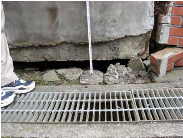
写真7 庁舎北西側(文書館)周辺地面沈下 (沈降幅 0.1m) (幸手市東)