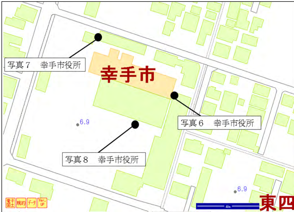
図4 震度観測点周辺拡大図（幸手市役所）