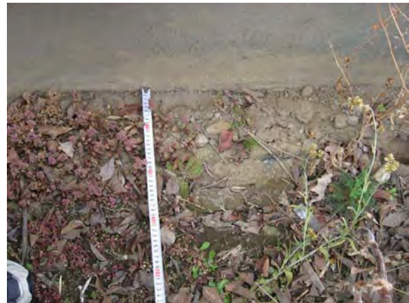
写真8 庁舎南側地面ひび割れ (長さ 0.3m 深さ 0.32m) (幸手市東)