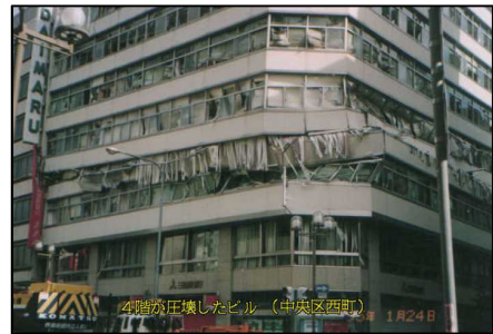
阪神・淡路大震災（震度7の地域） 4階がつぶれたビル

この機会に、災害時のボランティア活動や自主的な防災活動への理解を深め、ひとりひとりが自ら行動しお互いが助け合う安全・安心な地域づくりについて考えてみてはいかがでしょうか。