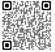
通知サービスについて

災害時、住民は「 自らの命は自ら守る 」意識を持ち、自らの判断で避難行動をとる必要があります。避難が必要とされる 警戒レベル4 に相当する危険度の高まりについて、気象庁協力のもとで民間事業者がメールやアプリで通知を行うサービスがあります。