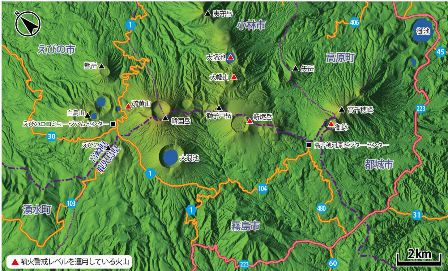
※この地図は国土地理院の地理院タイル(色別標高図)を使用して作成しています