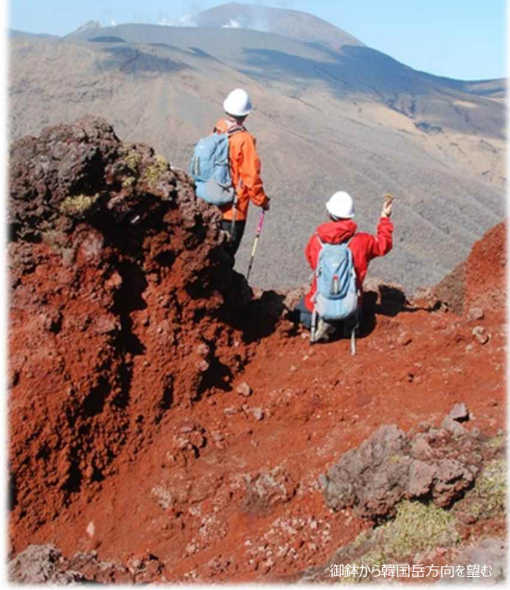
御鉢から韓国岳方向を望む

霧島山は美しい自然に恵まれた活火山です。火山や気象の情報を上手に利用して楽しみましょう。