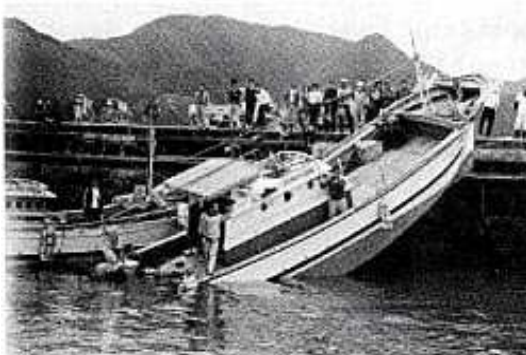
1979年3月31日の長崎県福江島富江港での船舶乗揚げ被害

観測史上最大の「あびき」は、1979年（昭和54年）3月31日に長崎検潮所（長崎県）で観測されたもので、最大全振幅（海面昇降の谷から山までの高さ）が278センチに達しました。