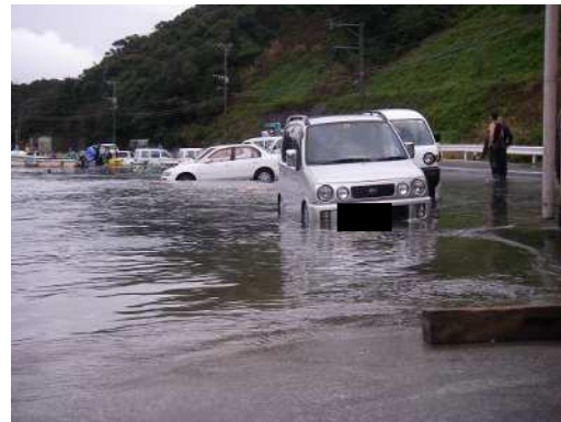
2009年2月25日の鹿児島県上甕島での道路冠水