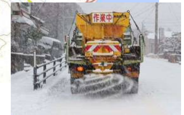
融雪剤散布作業状況