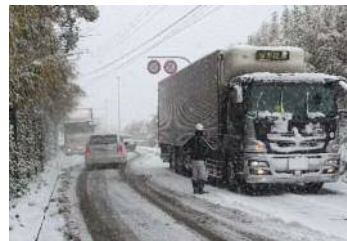
スタック車両の状況 (2016年1月)