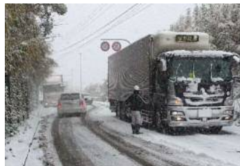
立ち往生車両の状況 (2016年1月)