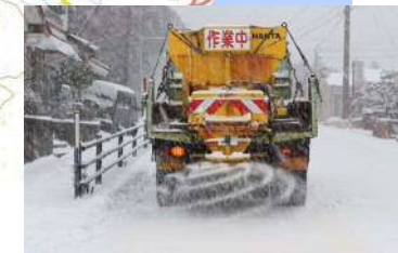
融雪剤散布作業状況