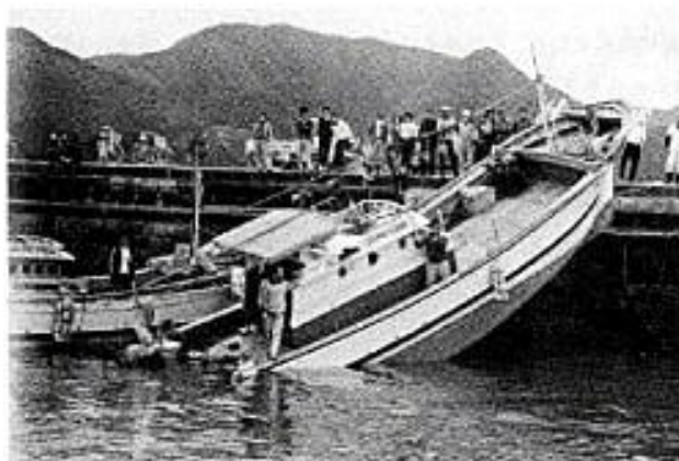
写真 1979年3月31日の長崎県福江島富江港での船舶乗揚げ被害（西部海難防止協会「津波（長崎港アビキ）対策調査委員会報告書」（昭和57年3月）より）