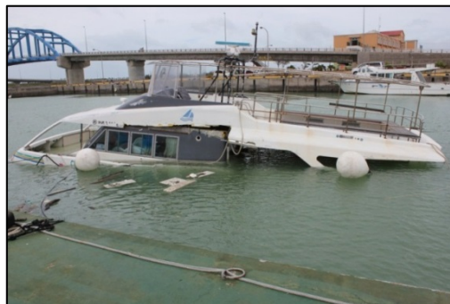
暴風により破壊された車（気象台職員撮影） 高波により沈没した船（気象台職員撮影）