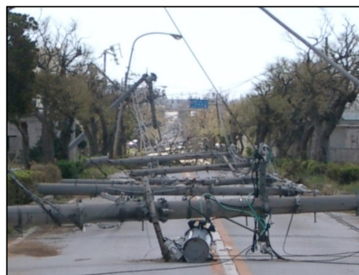
暴風により破壊された車（気象台職員撮影） 暴風により倒壊した電柱（気象台職員撮影）