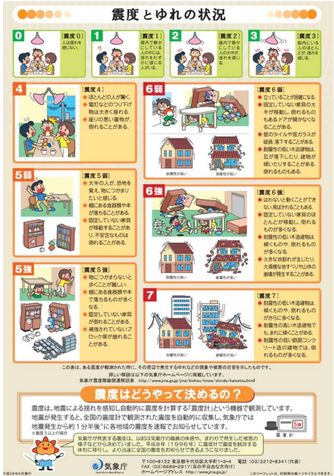
図1 気象庁震度階級関連解説表から作成したリーフレット「その震度どんないゆれ？」 https://www.jma.go.jp/jma/kishou/known/shindo/kaisetsu.html