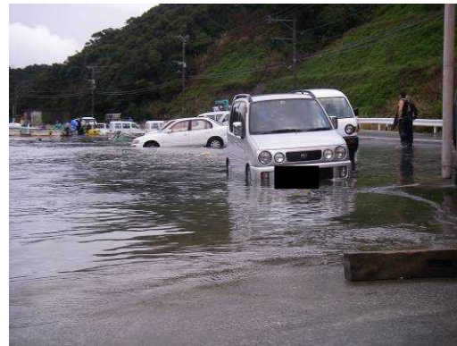
2009年2月25日の鹿児島県上甕島での道路冠水（薩摩川内市上甕支所提供）