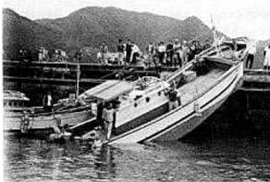
1979年3月31日の長崎県福江島富江港での船舶乗揚げ被害（西部海難防止協会「津波（長崎港アビキ）対策調査委員会報告書」（昭和57年3月より）

観測史上最大の「あびき」は、1979年（昭和54年）3月31日に長崎検潮所（長崎県）で観測されたもので、最大全振幅（海面昇降の谷から山までの高さ）が278センチに達しました。