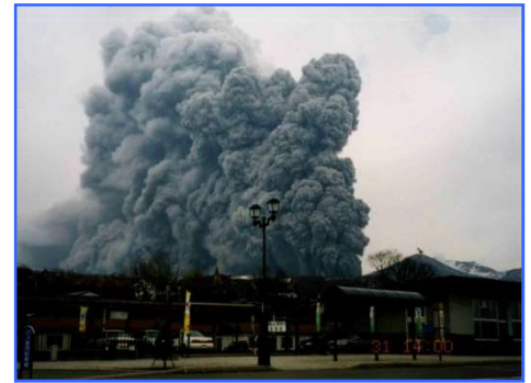
平成12年(2000年)有珠山噴火