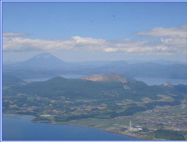
南東上空から見た有珠山