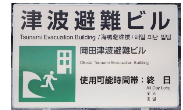
Bangunan Evakuasi Tsunami