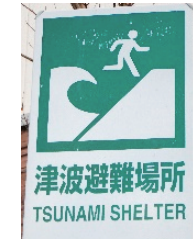
Tempat Evakuasi Tsunami