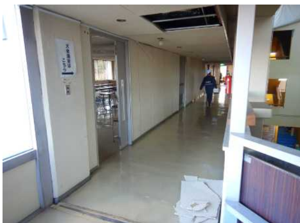
写真1 天井材の落下