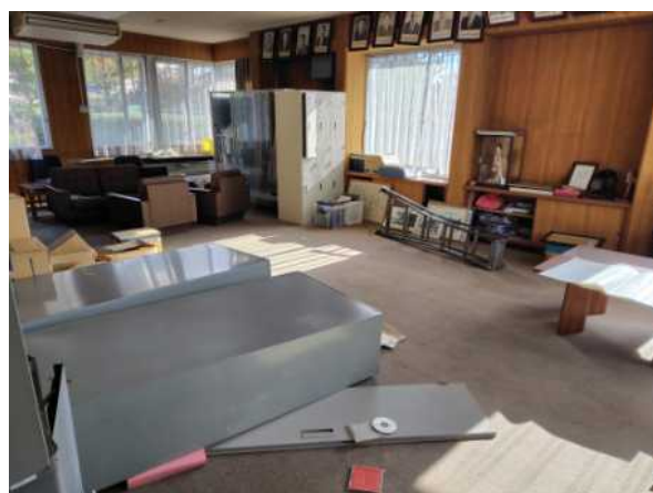
写真4 書庫の転倒 (耐震固定無し)