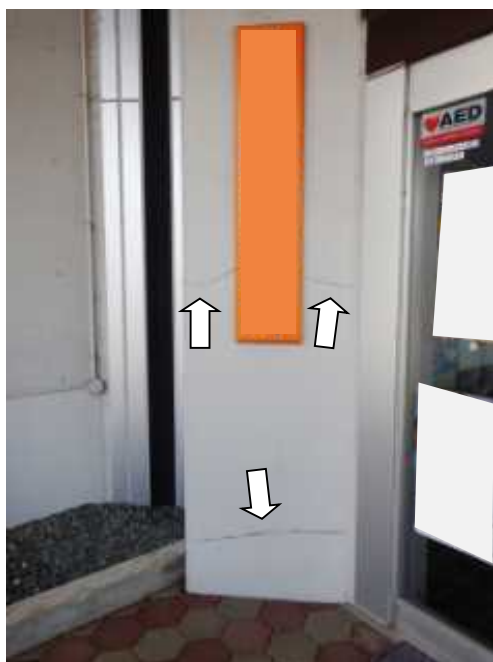
写真3 事務所の柱の亀裂