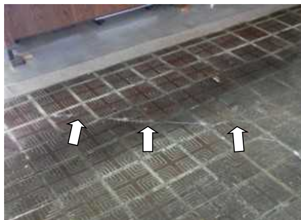
写真2 床タイルの亀裂