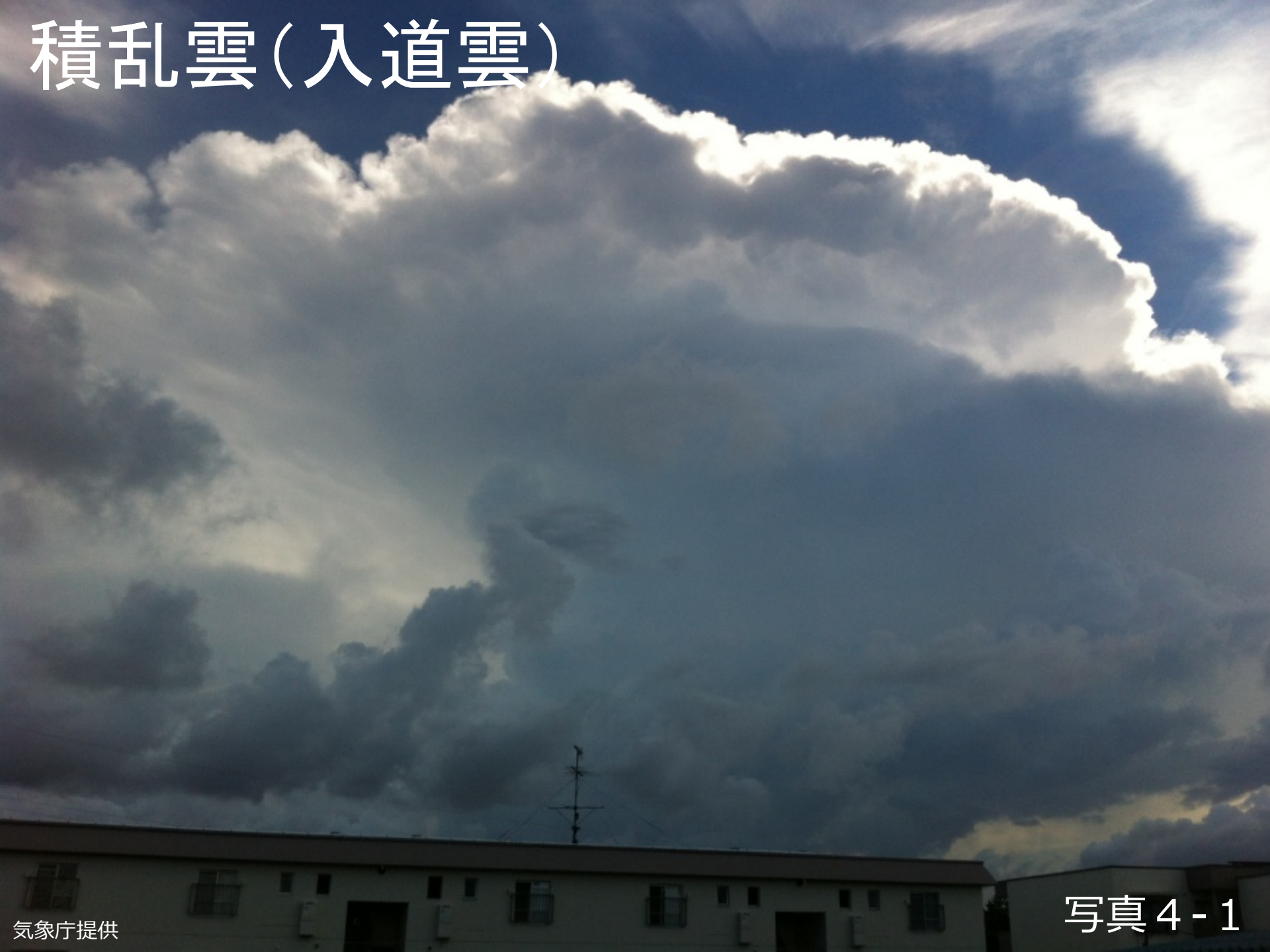
写真 4 - 1